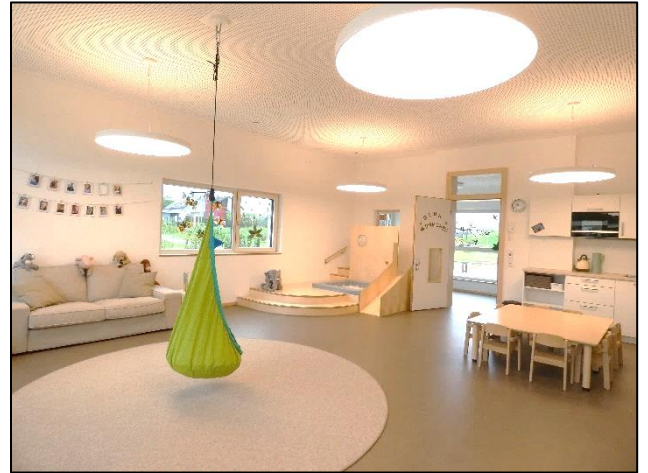
Glühwürmchen – Gruppenraum