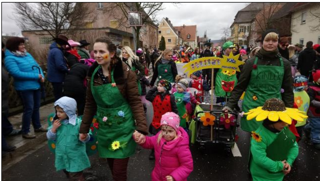
Auf geht's Blümchen!