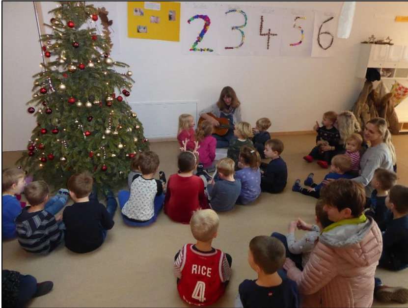
Singen unterm Weihnachtsbaum

Beim gemeinsamen Singen von Weihnachtsliedern unter dem Christbaum müssen uns wohl die Engel gehört haben. Als wir wieder in unsere Gruppenräume zurückgegangen sind, waren für die Kinder viele Geschenke da. Jedes Kind durfte ein Geschenk auspacken. Darin waren Spielsachen für die Gruppe.