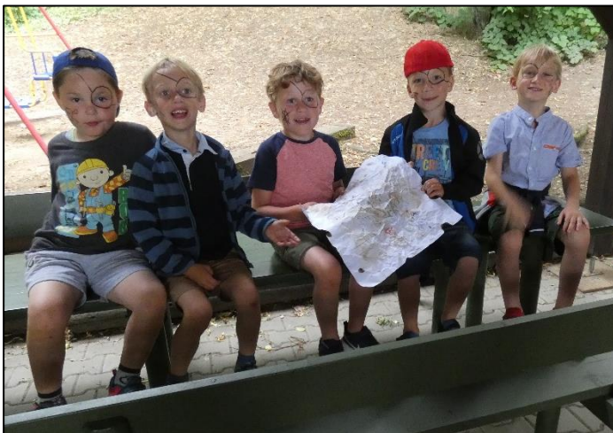
Echte Piraten mit Schatzkarte