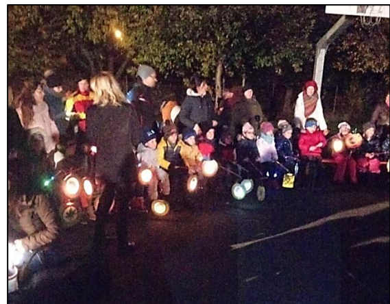
Gemeinsame Versammlung im Dorfgarten