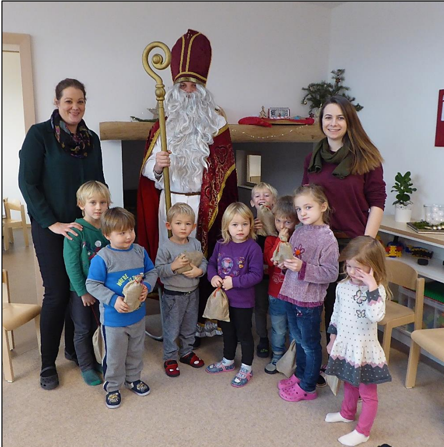
Der Bischof Nikolaus bei den Schmetterlingen

Am 6. Dezember 2019 stattete uns der Bischof Nikolaus einen Besuch ab. Nachdem er uns aus seinem goldenen Buch vorgelesen hatte, schenkte er jedem Kind einen kleinen Sack gefüllt mit Nüssen, einer Mandarine, einem Apfel und einem großen Schokoladennikolaus, gespendet von Rewe.