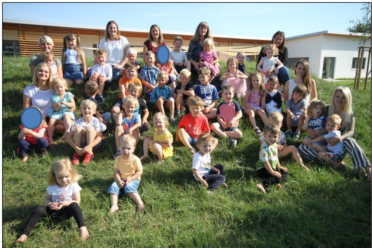
Unsere ganze Kita