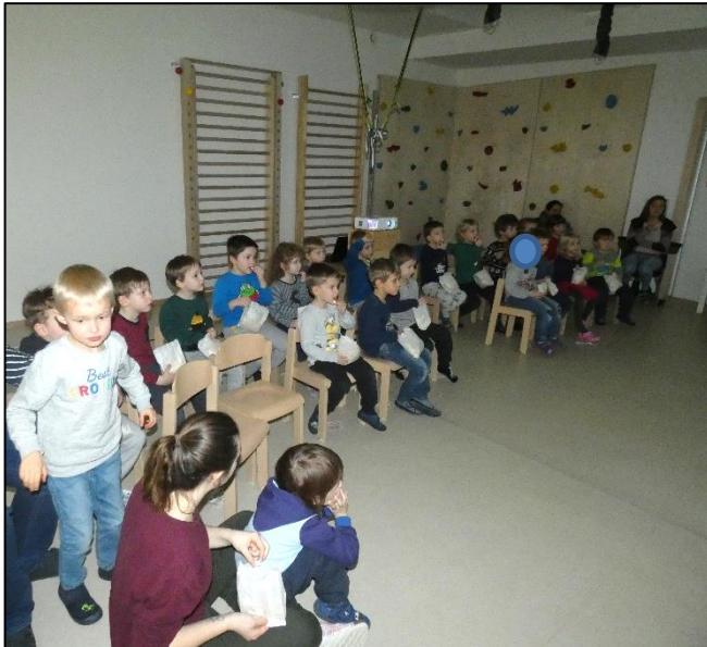
Platz nehmen auf den Kinostühlen

Nach einer ausgiebigen Vorbereitungsphase mit Gesprächen über Eisbären, dem Basteln von Tickets und dem Herstellen von selbstgemachtem Popcorn, verwandelten wir unsere Turnhalle in ein echtes Kino. Der Film „Lars der kleine Eisbär“ fesselte uns alle!