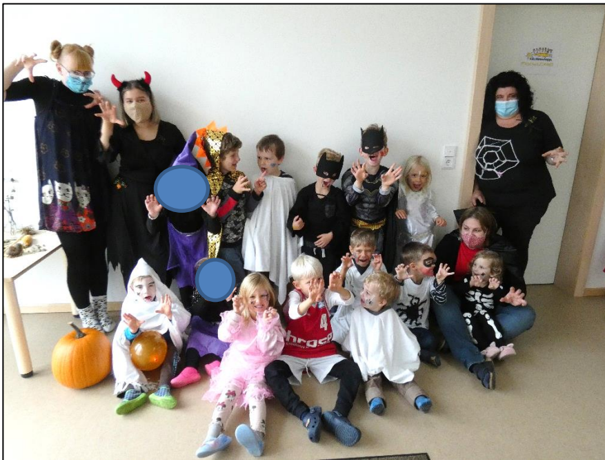
Halloween bei den Käfern

Auch unsere Halloween Party war gruppenübergreifend geplant, doch mal wieder zog uns die Pandemie einen Strich durch die Rechnung. Deshalb feierten wir gruppenintern mit Kinderschminken und gruseligen Spielen.