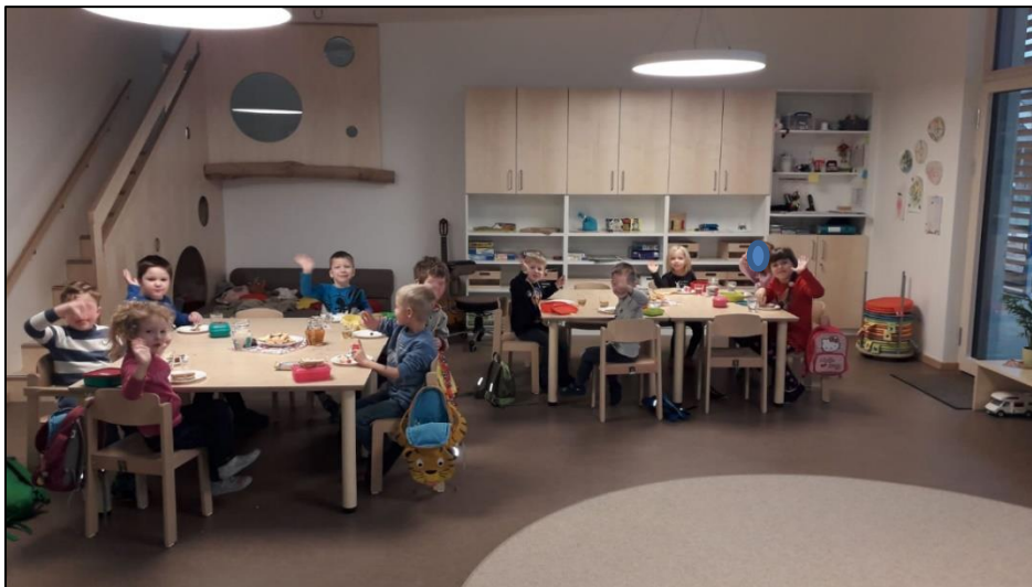
Käfergruppe – Gruppenraum