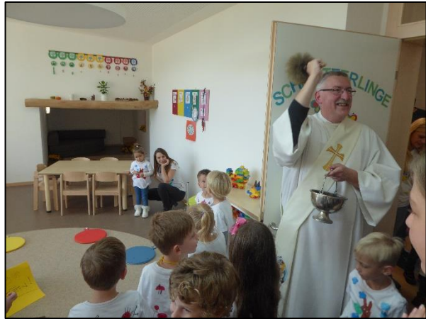
Segnung der Räumlichkeiten