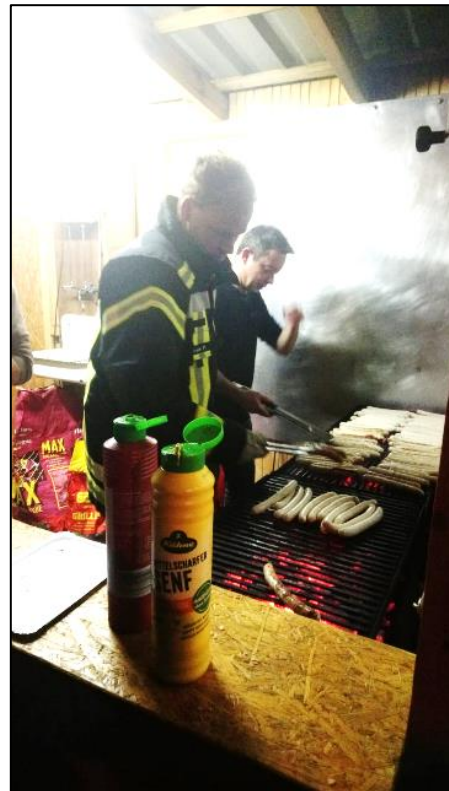
Grillmeister am Werk