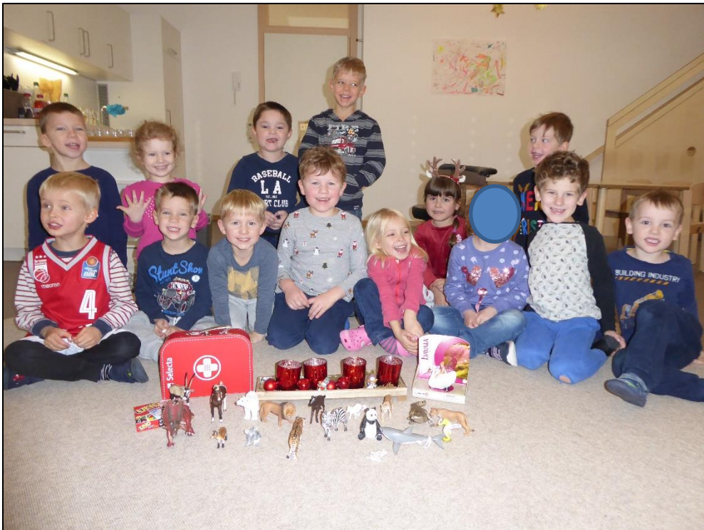
Nach der Bescherung bei den Käfern