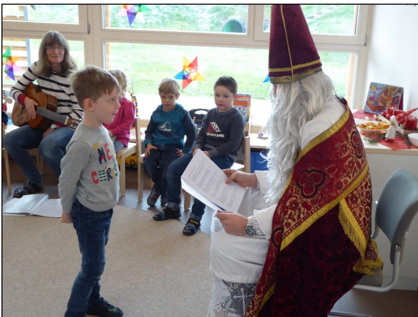
Der Bischof Nikolaus bei den Käfern