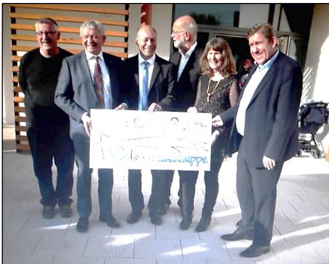
Unsere prominenten Gäste