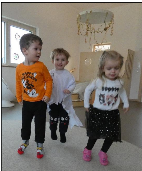
Halloween bei den Glühwürmchen