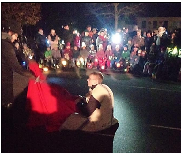
St. Martin teilt seinen Mantel