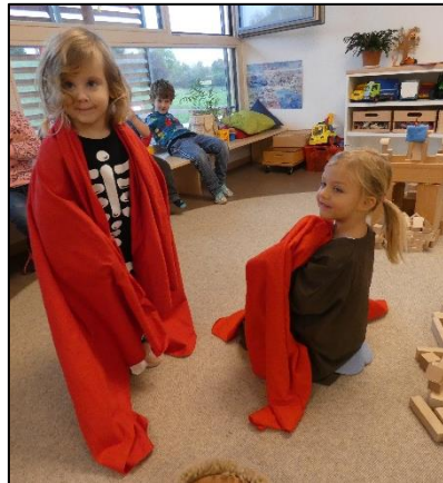
Jeder darf mal St. Martin sein