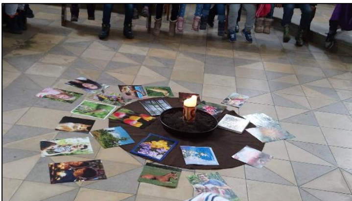
In der Kirche