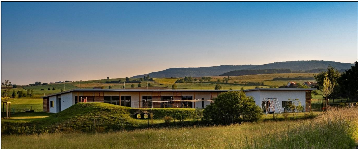
Kindertagesstätte Sternschnuppe bei Tag von H. Sommer

Nicht zu vergessen ist unsere Gemeinde! Unterstützt durch den Bürgermeister und seine Mitarbeiter können verschiedene Krisen gemeinsam erfolgreich bewältigt werden. Wir danken uns für die, von gegenseitigem Vertrauen geprägte, Zusammenarbeit.