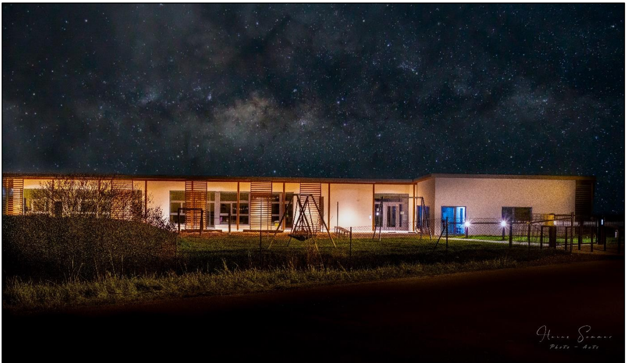
Kindertagesstätte Sternschnuppe bei Nacht von H. Sommer

Wir freuen uns schon, wieder neue wundervolle Ereignisse mit unseren Kindern zu erleben und mit Ihnen zu teilen!