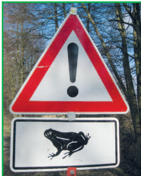
Foto und Text (leicht geändert): Kitzrettung Oberfranken e.V., weitere Informationen unter www.kitzrettung-oberfranken.com